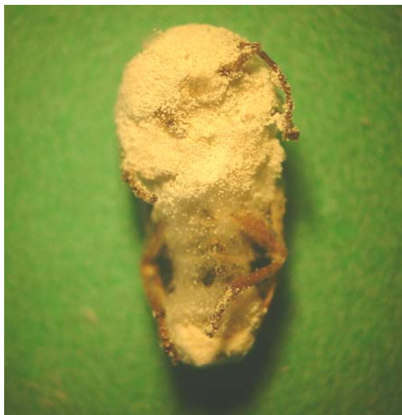
Adultos de vaquita del olmo parasitados por el hongo entomopatógeno Beauveria bassiana .