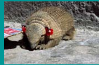
Peludito 'vestido' para las ceremonias tradicionales ('mesa')

En estas actividades fue fundamental la utilización de los folletos educativos sobre el gato andino y la proyección de presentaciones. En la localidad de Socaire se realizaron una serie de charlas con la cooperación activa del director de la escuela y en las cuales se aplicaron las actividades propuestas en la Guía para Educadores. Este ciclo de encuentros con los estudiantes se focalizó en la conservación de los flamencos y el gato andino.