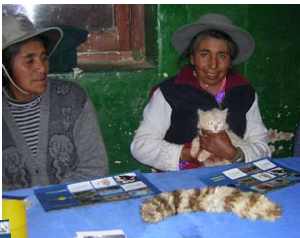
Arriba: Escuela en Cusi-Cusi, Jujuy Abajo: Taller comunitario en Coranzuli, Jujuy